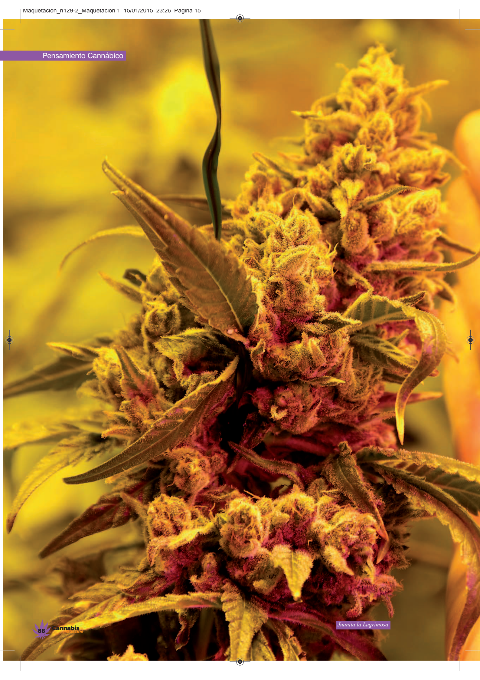
Juanita la Lagrimosa