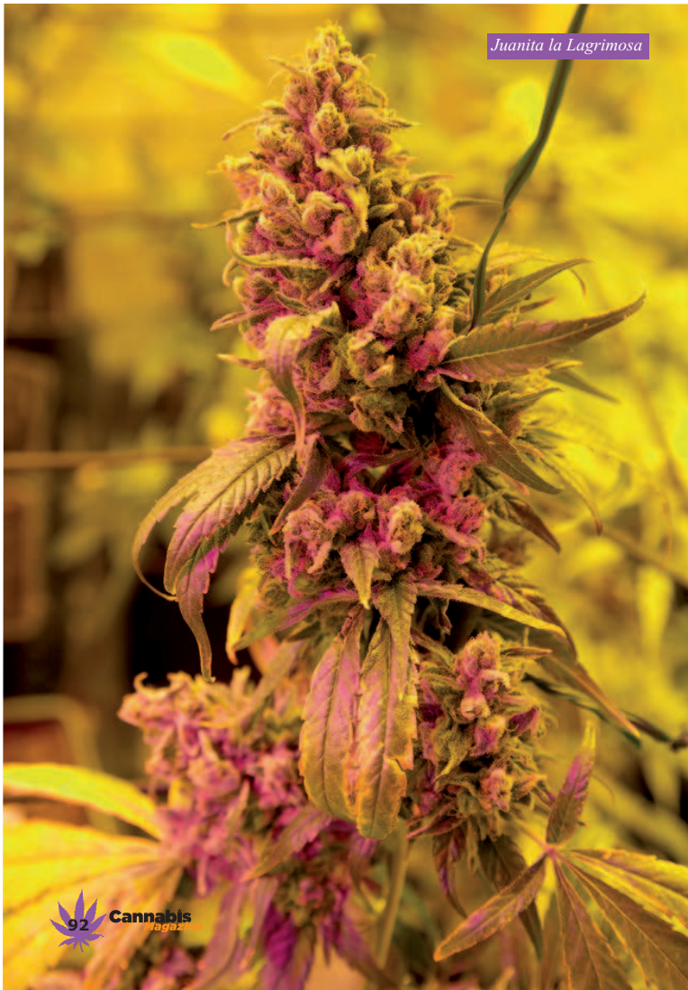
Juanita la Lagrimosa

LAS VARIEDADES CBD-RICH MARCARÁN UN ANTES Y UN DESPUÉS EN LA FORMA QUE TENEMOS DE CONCEBIR LA MARIHUANA