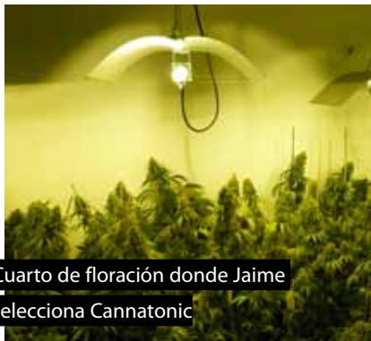
Cuarto de floración donde Jaime selecciona Cannatonic

Más tarde, me cuelo del salón al cuarto de trabajo de Anna, donde lleva toda la