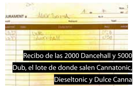
Recibo de las 2000 Dancehall y 5000 Dub, el lote de donde salen Cannatonic, Dieseltonic y Dulce Canna