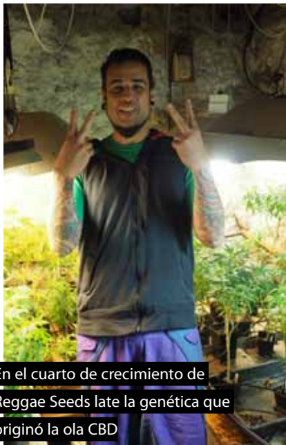
En el cuarto de crecimiento de Reggae Seeds late la genética que originó la ola CBD

La ola CBD empezó en Girona y allí se mantuvo los primeros años, a un ritmo lento, pero seguro, en los últimos años ya se conoce en todo el mundo. Es tiempo de una actualización de aquellos históricos primeros artículos del 2011. Aunque son los más completos que se han publicado